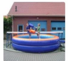
Zwembad met balansbalk

Gesponsord door de ondernemers van Ermelo en omstreken. De opbrengst van deze dag komt voor 50% ten goede aan ons zendingsdoel: